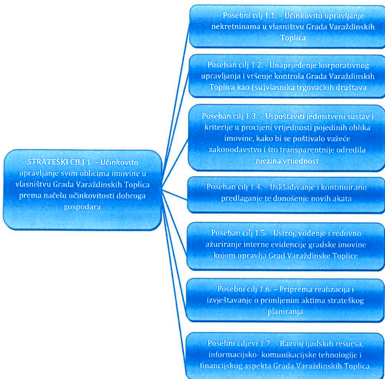
Slika 2. Kaskadiranje strateškog cilja upravljanja gradskom imovinom